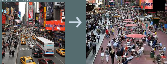
N.Y.タイムズスクエアは車主体から歩行者主体へ

世界の主要都市は都市間競争に打ち勝つため、都心部を大胆に改造して歩行者主体の街づくりを進めている。