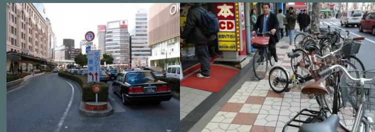
駅前広場を自動車占める

難波駅周辺は大阪を代表する世界レベルの観光地であり、お客さまを迎える駅前を抜本的に改善し、御堂筋と一体となった魅力化が急務。