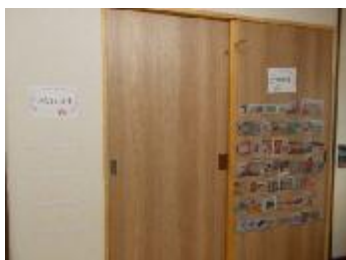
余暇時間の中で使える課題の作成や、遊べるおもちゃのリスト作り