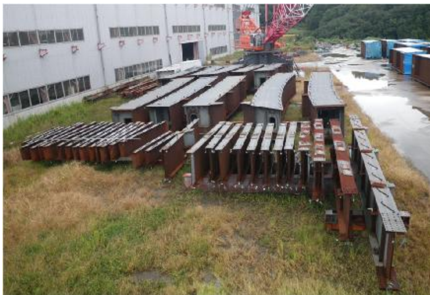
工場での保管状況写真 (平成23年10月5日撮影)

平成21年10月 1日 材料入荷 平成21年11月 5日 製作開始 平成23年 2月25日 組立検査 平成23年 3月11日 東北地方太平洋沖地震発生 以降、工場にて保管(屋外)