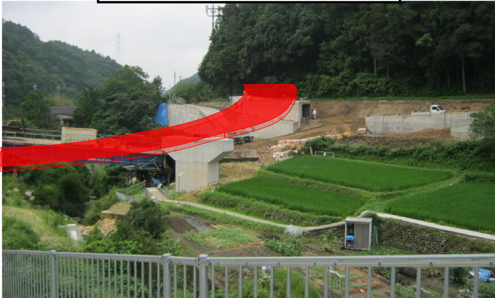
橋梁完成イメージ図(赤色着色部分)