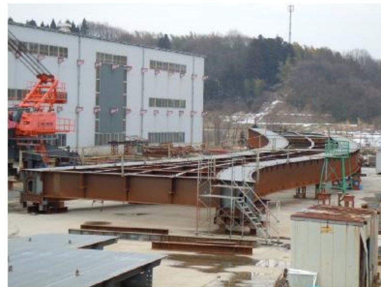
工場での組立状況写真 (平成23年2月18日撮影)