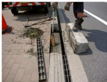
▲ 境界ブロック補修