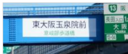
▲〔府〕大阪中央環状線 意岐部歩道橋（東大阪市）