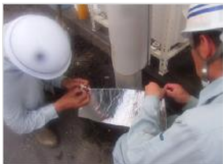
▲ 道路照明灯の修繕

車両による道路パトロールで発見できない歩道等の不具合箇所を徒歩により発見し、速やかに対応します。