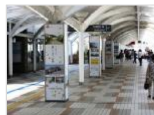
▲ 千里中央駅 連絡通路