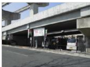
▲〔府〕茨木摂津線清水高架橋下 （茨木市）