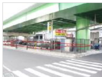
▲一般国道170号新町跨道橋高架下 （東大阪市）