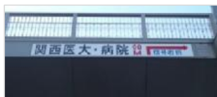
▲〔府〕京都守口線 枚方市駅前横断歩道橋

【実績】平成17年度から平成26年度までに11橋実施 〔金額換算で約5,000万円の費用を企業等が負担〕