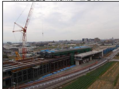
府道泉佐野岩出線 (泉南市～和歌山県境)