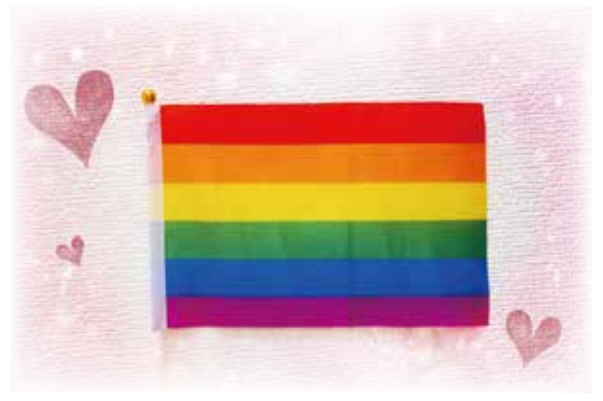
性的マイノリティの尊厳と社会運動を象徴する「レインボーフラッグ」 上から赤（生命）・橙（癒し）・ 黄（太陽）・緑（自然）・藍（平穏／調和）・ 紫（精神）の6色で、性の多様性を表しています。