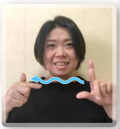
「LGBTQ」の手話表現 「L+いろいろ」と表す

* 「ろう」とは、聴覚障がい者の一区分です。聴覚障がい者には中途失聴者、難聴者、ろう者など様々な立場の人がいます。ろう者はその中でも音声言語を習得する前に失聴した人で、そのため手話を第一言語としている人がほとんどです。