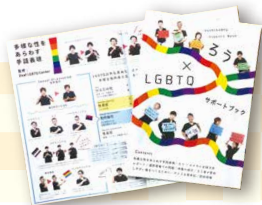
ろう × LGBTQ サポートブック

そのような偏見や誤解を減らすため、「ろう × LGBTQ サポートブック」を作成しました。サポートブックでは、LGBTQ 以外の手話表現「パンセクシュアル」、「X ジェンダー」などさまざまな性自認・性的指向を取り巻く状況の表現を掲載しています。そのような手話表現を掲載することで、ろう LGBTQ や手話通訳者 / サポートする側が安心して参加できる場所を増やすために活動を続けています。