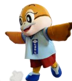
大阪府広報担当副知事 もすやん