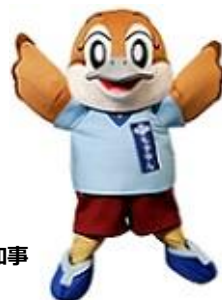
大阪府広報担当副知事 もずやん