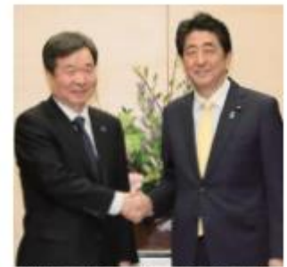
安倍総理は、本年3月に来日したBIE調査団に対し、オールジャパンで万博誘致活動を進めていると説明

※2025年万博の開催 開催地は、2018年11月のBIE総会において、 加盟国の投票により立候補3か国の中から決定されます