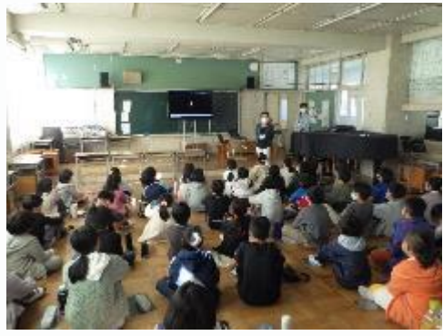
市民団体アクアフレンズより (大和川付け替えの歴史)