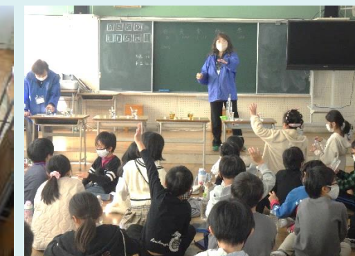
水に含まれていると思う調味料を発表