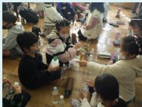
水の色、においを確認