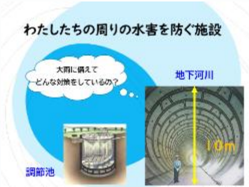
八尾土木事務所より (川のごみ問題、大雨と川の危険性)