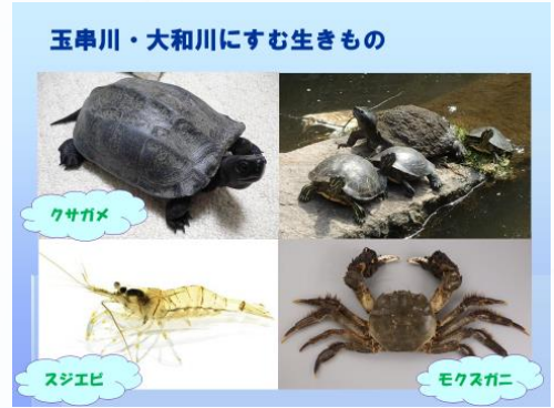
中部農と緑の総合事務所より (大和川と玉串川の水環境、生き物)