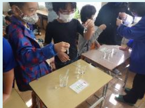
パックテストの色の变化を確認

水の汚れは見た目だけではわかりません。それを子供たちに知ってもらうため、ペットボトルの水に少量の調味料を入れたものを5種類用意し、パックテスト(試薬を使った調査)の結果や、水の色、においから、何の調味料が入っているかを当てるクイズを行いました。