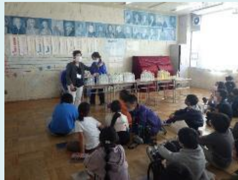
市民団体アクアフレンズより (水を汚さないために…)