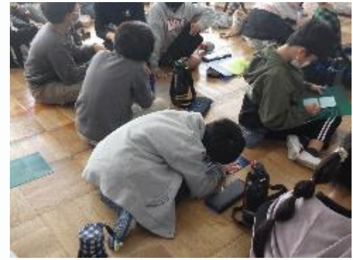
授業の感想を記入