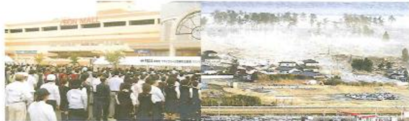
泉南市・イオン合同防災訓練 23.10.15