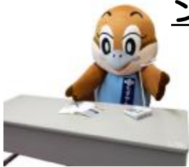
大阪府広報担当副知事 もすやん