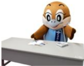
大阪府広報担当副知事 もすやん