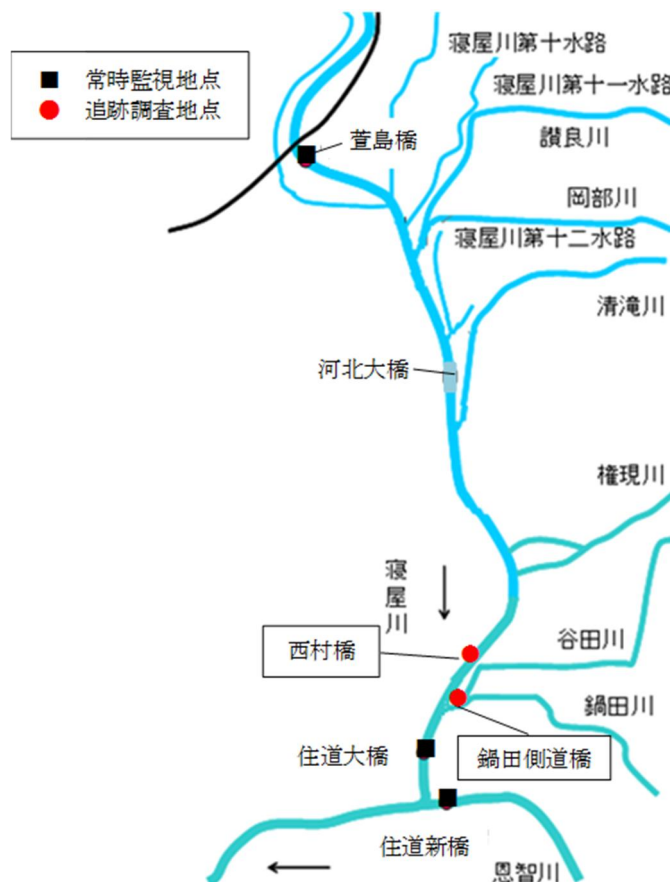
図1 寝屋川追跡調査地点図

令和4年度は、令和3年度に引き続き、「西村橋」「鍋田側道橋」を再度調査するとともに、今回超過した鍋田側道橋上流域の状況を把握するため、谷田川、鍋田川にて追跡調査を実施します。