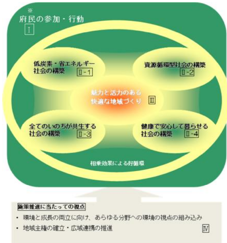
計画に定める各分野の関連についての概念図

また、新計画に基づく進行管理の方法を検討し、新たな方法による計画の進行管理を開始しました。