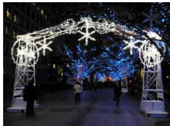
＜おおさか銀河都市大作戦！ イメージ＞

【ESCO】Energy Service Company の略。電力の大口需要家に対して、省エネルギー診断やエネルギー効率の改善計画及び運用を行う事業のこと。 【包括的なESCO事業モデル】空調、照明、給排水その他包括的な省エネに関する診断から、ESCO導入のための設計、施工、保守、運転、管理、資金調達まで、すべてを一体的にサービス提供する事業モデル。