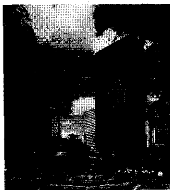
「平成 5 年度大阪都市景観建築賞（大阪まちなみ賞）大阪府知事賞受賞」 OBP 住友生命・近畿銀行ブロック

平成 5 年度は、新梅田シティを最優秀賞として表彰したほか、4 件の施設を表彰した。