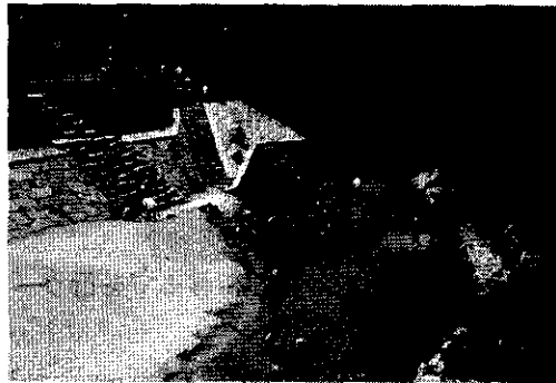
<天野川環境整備事業（交野市スポーツレクリエーションセンター付近）>