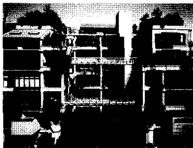
平成8年度 みどりの景観賞〔最優秀賞〕 実験集合住宅NEXT21