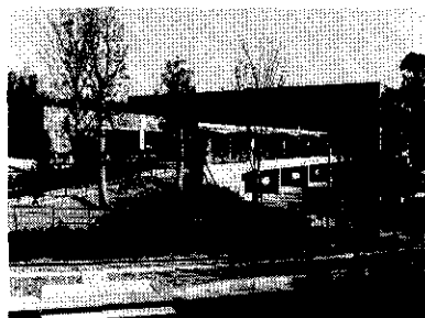
平成8年度 大阪まちなみ賞〔大阪府知事賞〕 熊取町立熊取図書館