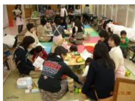
スーパーが売り場の一角を活動スペースとして無料で提供