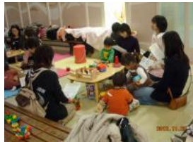
リース作りを待っている間 少しお話ししてみませんか？