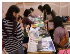
今回のメニューは「クリスマス リースづくり」