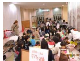
買い物のついでに広場の様子 を見て、訪れる人も