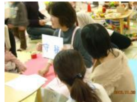
4つのルールを説明。ファシリ テーターは養成講座修了者