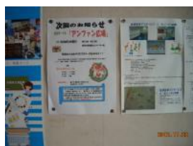
スーパーの案内版に掲示したり館内放送を流している