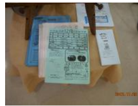
各地域の「つどいの広場」等の情報誌