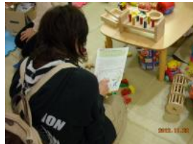
今回使用した教材は「かさね る」