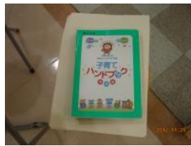
茨木市の子育てハンドブック