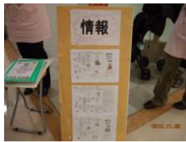
受付横に、子育てに関する情報をたくさん提供している