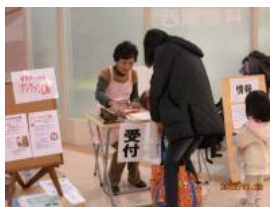
続々と受付をする親子 今回参加した親子は21組