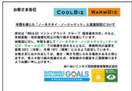
【省エネの取組みをPRするポスター】

年間を通じたクールビズ(4月~10月)・ウォームビズ(11月~3月)や階段利用の推奨、PC 端末等への省エネシールの貼付などの取組みを実施している。また、高効率な空調への更新や、照明のLED化にも取り組み、電力使用量を削減した。