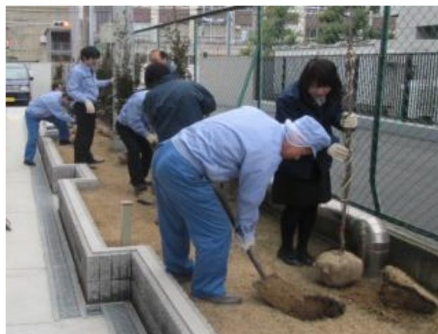
従業員による工場敷地内での配付樹木の植付作業