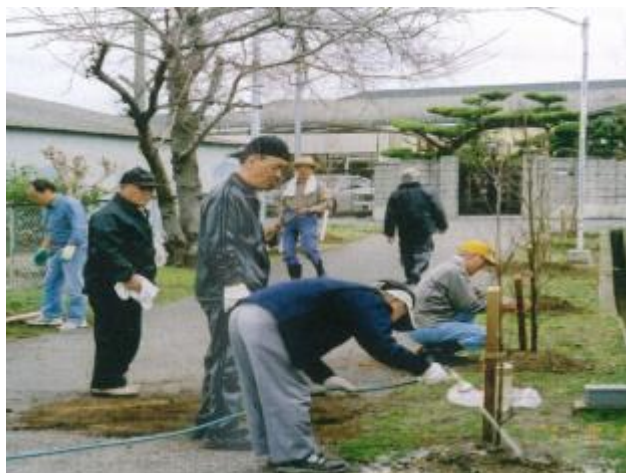
地域住民による配付樹木の植付作業