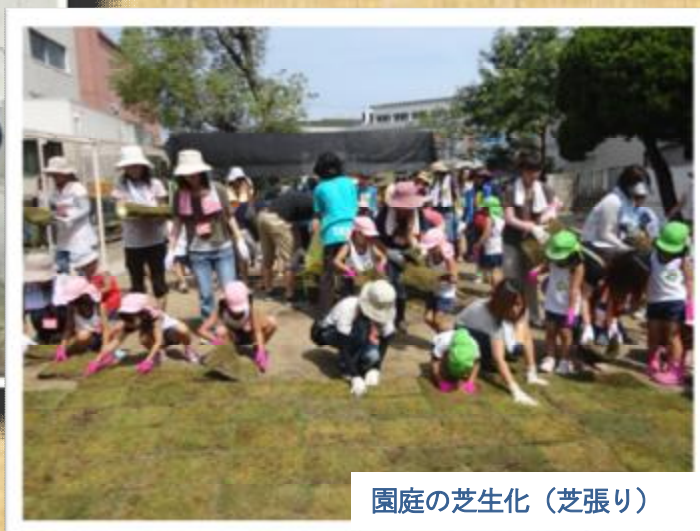
園庭の芝生化（芝張り）