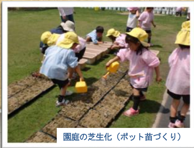
園庭の芝生化（ポット苗づくり）