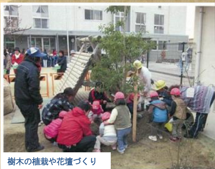
樹木の植栽や花壇づくり