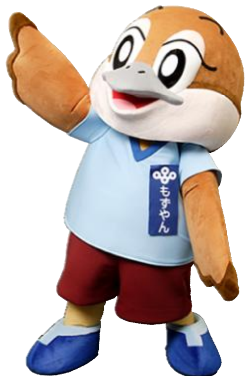
大阪府広報担当副知事もずやん