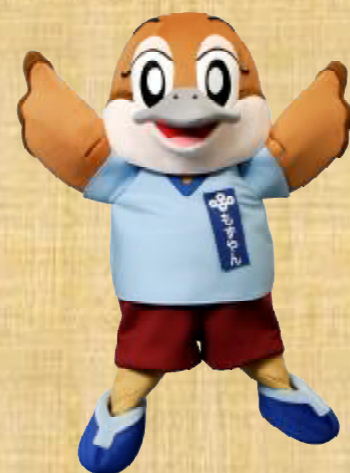
大阪府広報担当副知事もずやん