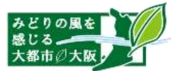
【みどりの風ロゴマーク】