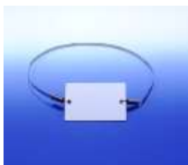
【樹木にかけるタイプの樹名板例】