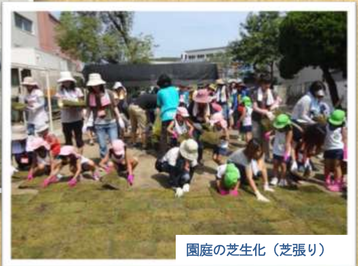
園庭の芝生化（芝張り）