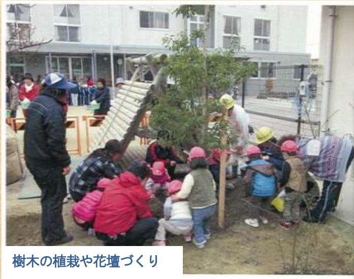
樹木の植栽や花壇づくり