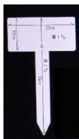
【土にさすタイプの樹名板例】