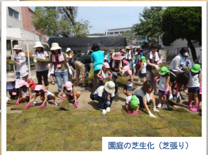
園庭の芝生化（芝張り）