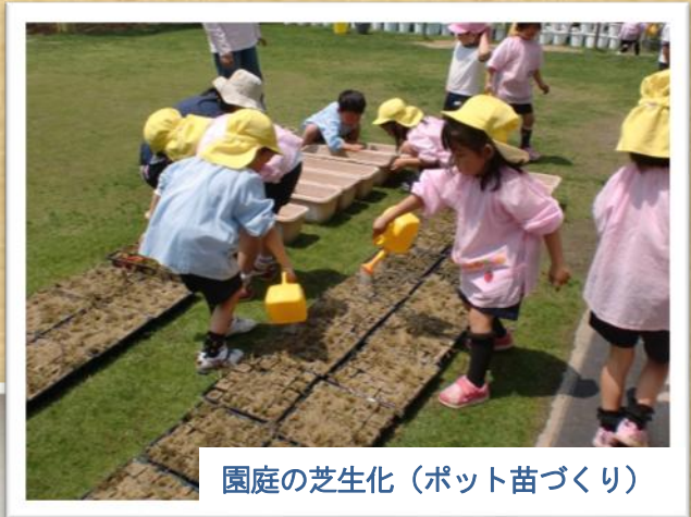
園庭の芝生化（ポット苗づくり）