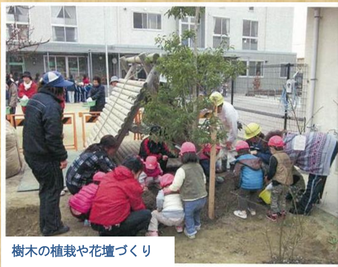
樹木の植栽や花壇づくり