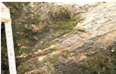
柿の木についた爪痕 4～5本の平行線