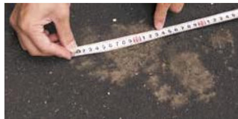
足跡には指の跡が5本 手のひら部分は人間の大人の ものと同程度の大きさ