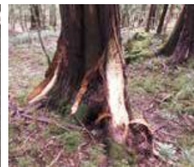
木の皮を剥いだ痕