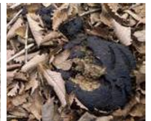
糞は不定形で繊維 や木の実の種が含まれる