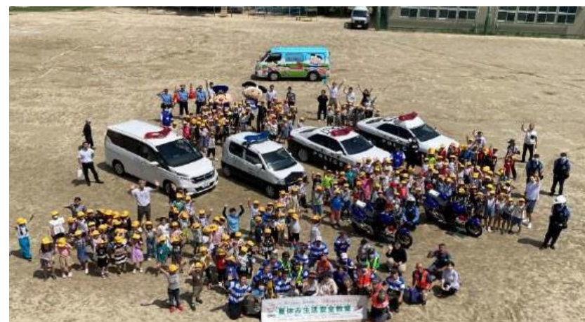
※ 夏休み生活安全教室の様子