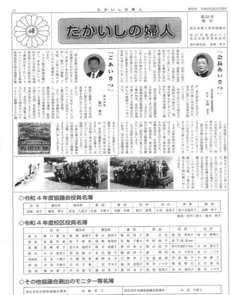
※ 警察との合同パトロール