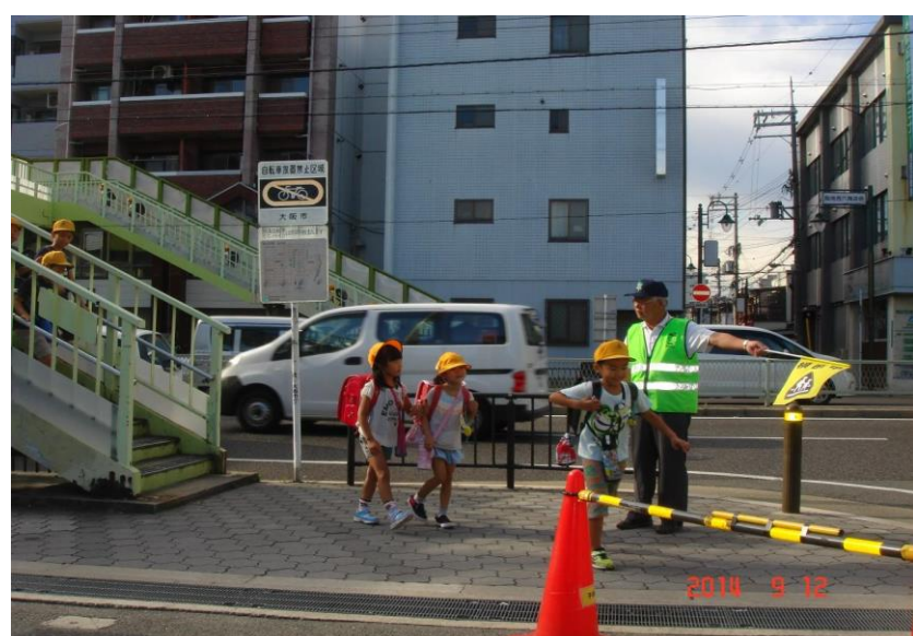
※ 平成26年のころの活動写真

平成19年10月から約15年にわたり、活動を続けており、阪南連合町会の活動をきっかけに周辺地区でも防犯ボランティア団体活動が活発になるなど、地域防犯力向上に多大な貢献をしている。