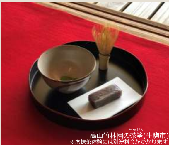
高山竹林園の茶筌(生駒市) ※お抹茶体験には別途料金がかかります