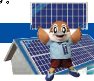
大阪府広報担当副知事 もずやん

事業者の皆さまに太陽光パネルを初期投資不要でお得に導入いただける共同調達支援事業を実施します。 太陽光発電の導入により、経営の脱炭素化と電気料金高騰のリスク低減を図ることができます。ぜひご検討ください。