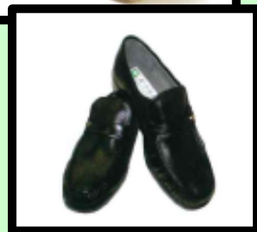
(展示物のイメージ)