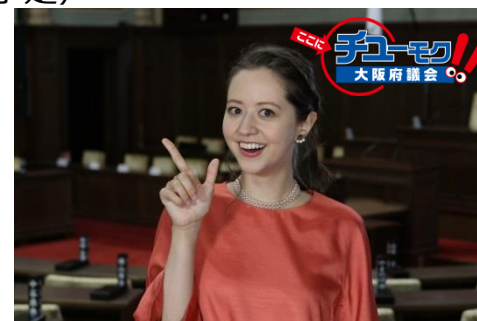
議会広報テレビ番組