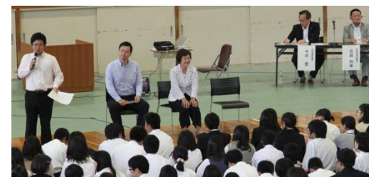
大阪府議会 出前授業