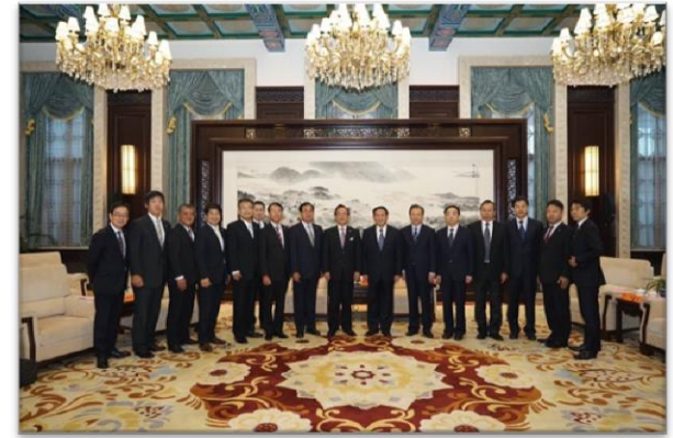
大阪府議会 中国友好訪問代表団