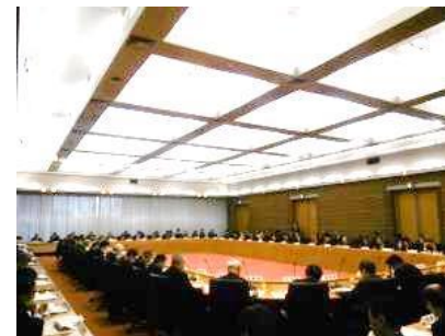
全国議長会定例総会