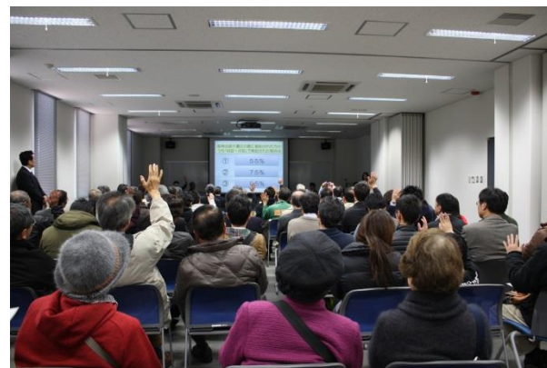
大阪府議会 出前講座