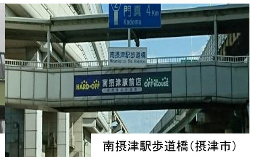
南摂津駅前歩道橋(摂津市)