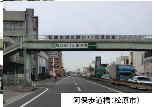
阿保歩道橋(松原市)