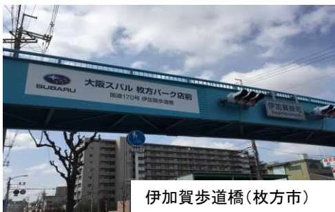
伊加賀歩道橋(枚方市)