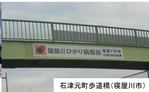
石津元町歩道橋(寝屋川市)