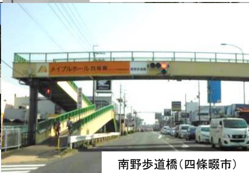
南野歩道橋(四條畷市)