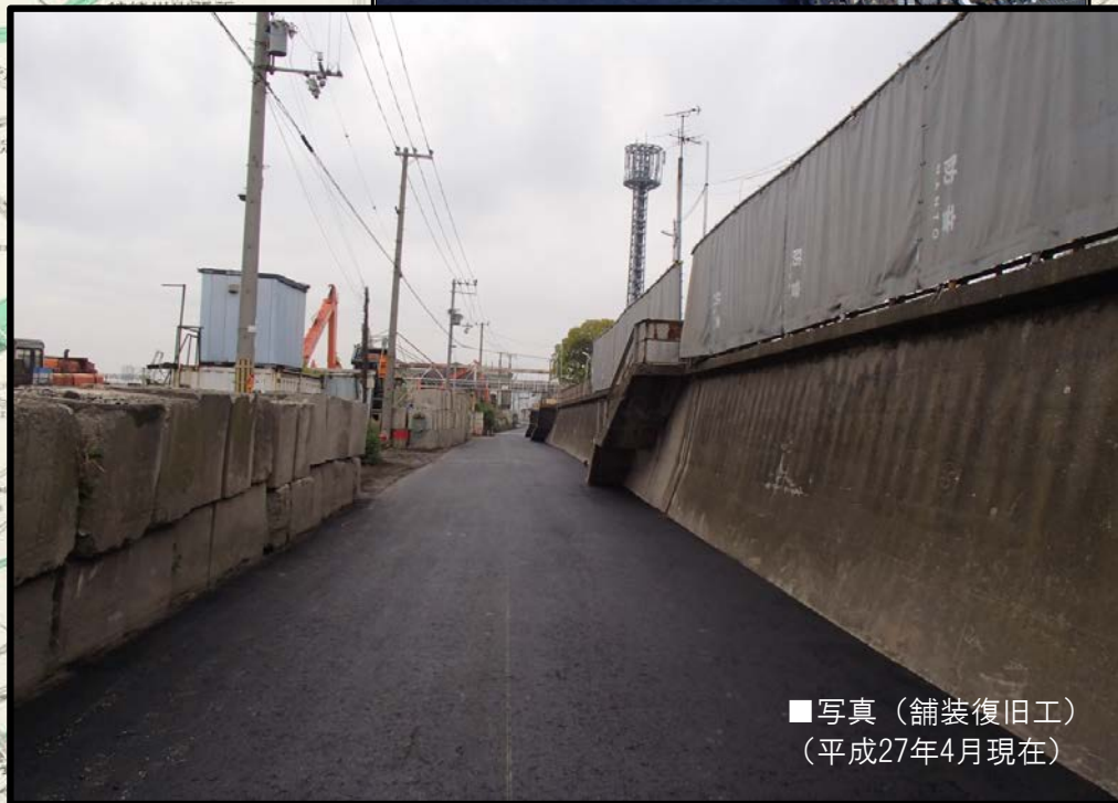
■写真 (舗装復旧工) (平成27年4月現在)