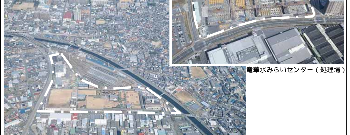
川俣水みらいセンター(処理場)