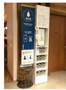
（左）大阪城公園 JO-TERRACE OSAKA （エレベーターホール） （右）無印良品店舗