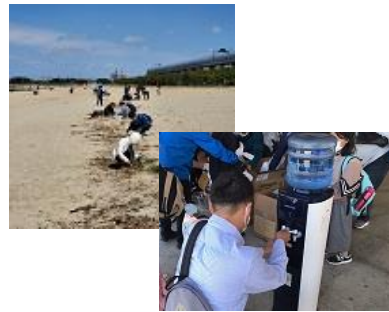
ブルーオーシャン作戦 潮干狩りの前に、みんなで「プラ干狩り」(R4.4.16)