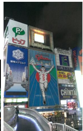
道頓堀グリコネオン