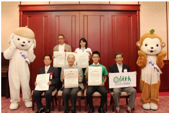
【府民活動部門受賞者の皆様】

平成 26 年度の受賞者については下記のとおり決定し、去る 9 月 1 日に、大阪府公館において表彰式を行いました。表彰式では、受賞された活動内容について府民会議の竹柴清二事務局長（大阪府環境政策監）から紹介があり、大阪府の小河保之副知事から受賞者の皆様に賞状が手渡されました。