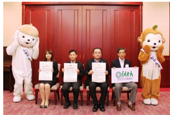
【事業活動部門受賞者の皆様】