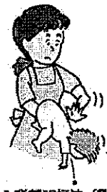
図1 背部叩打法（乳児）

乳幼児では、口の中に指を入れずに、乳児は片腕にうつぶせに乗せ顔を支えて（図1）、また、少し大きい子は立て膝で太ももがうつぶせにした子のみぞおちを圧迫するようにして（図2）、どちらも頭を低くして、背中をまん中を平手で4、5回叩きます。なお、腹部臓器を傷つけないよう力を加減します。