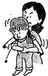
図3 ハイムリッヒ法（年長児）

大人や年長児では、後ろから両腕を回し、みぞおちの下で片方の手を握り拳にして、腹部を上方へ圧迫します（図3）。この方法が行えない場合、横向きに寝かせて、または、座って前かがみにして背部叩打法を試みます。