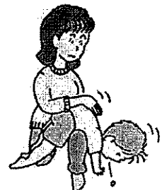
図2 背部叩打法変法（少し大きい子）