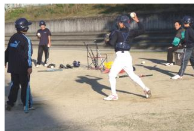
地域の方によるソフトボール指導 （幸小学校グラウンド）