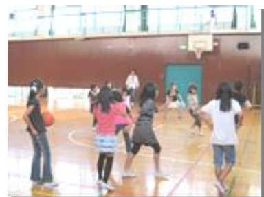
毎週木曜日の体育館開放も大人気です