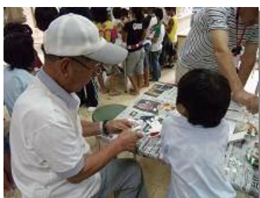
地域の方と一緒に工作教室、興味津々です