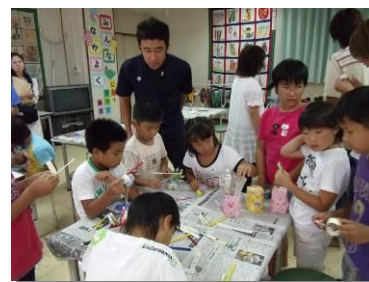
2つの児童室に参加する異年齢の児童が話し合いながら作品を作りあげていきます