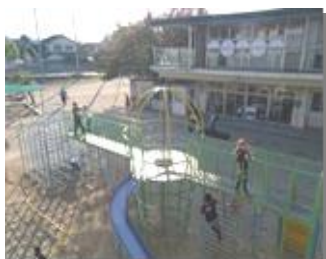
大切な放課後の居場所