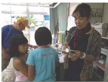
わからないことは、地域の方がやさしく教えてくれます