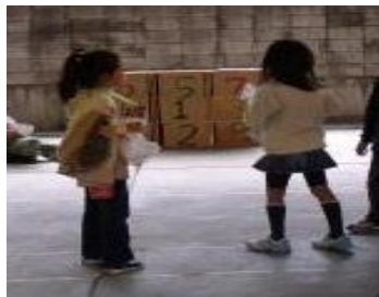
的あてコーナー。みんな真剣に的を狙います