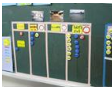
放課後児童クラブの子ども達は、マグネットを使って自分がどこで遊ぶのかを知らせます