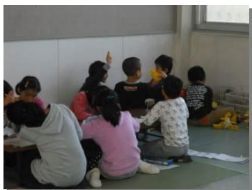
子どもたちは自分が決めた場所で楽しく過ごします