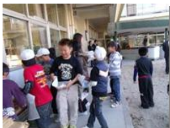
合同での焼き芋大会