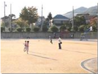
広々とした運動場で一緒に遊びます