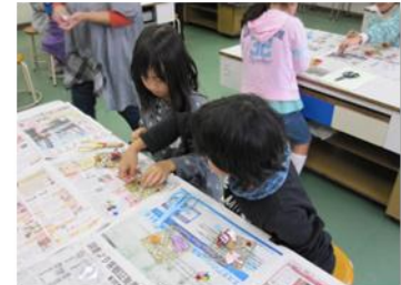
「講座」の一つ、フラワーアレンジメント