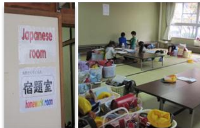
児童はまず部屋で宿題に取り組んだ後、遊びなどの活動に参加します