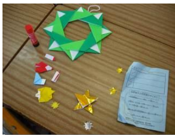
クリスマスリースをつくる活動もあります（放課後子ども教室）