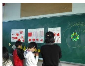
黒板には作り方の説明書を貼っており、自分でチャレンジします