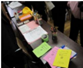
個人カードで出欠確認がスムーズにできるよう工夫されています