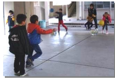
ボウリングは学年を越えて楽しめる遊びです