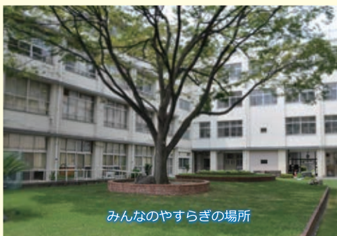
みんなのやすらぎの場所