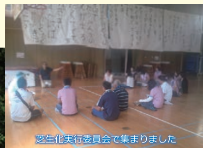
芝生化実行委員会で集まりました