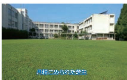
丹精こめられた芝生