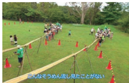
こんなそうめん流し見たことがない