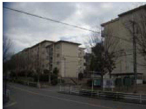
北西方より調査対象地（南側部分）