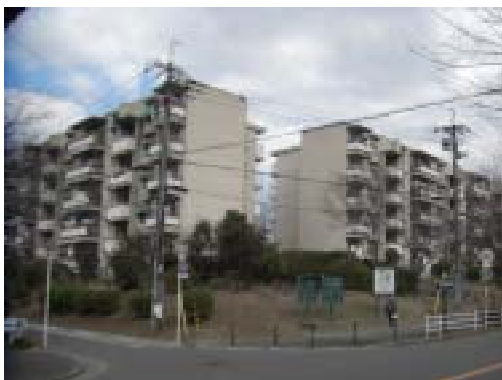
南西方より調査対象地