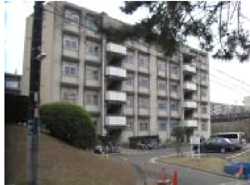
北東方より調査対象地