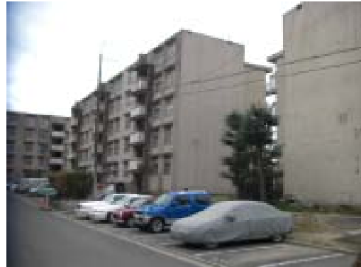
調査対象地北東側