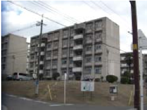
北西方より調査対象地