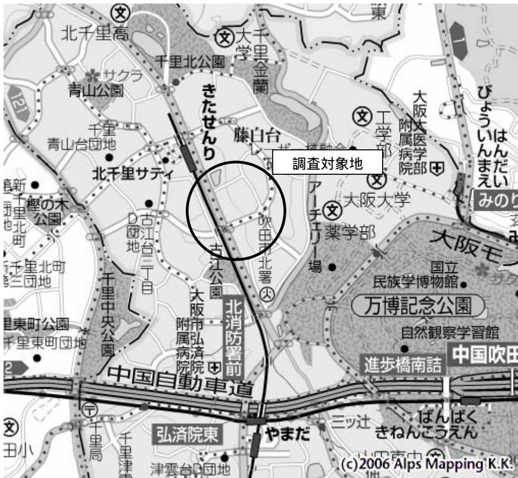
<調査対象地位置図>