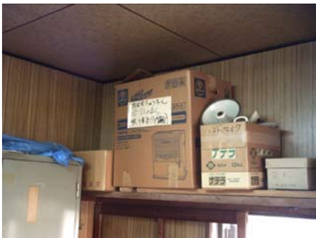
写真26 会議室上部棚