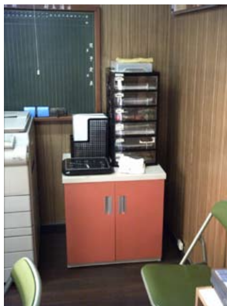
写真24 会議室物入れ(2)