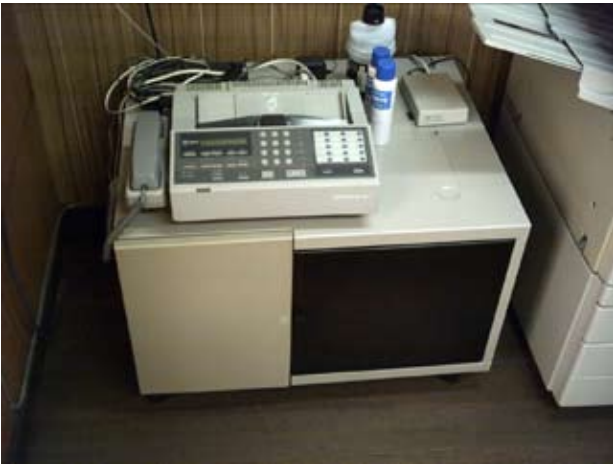
写真18 会議室物入れ(1)・FAX