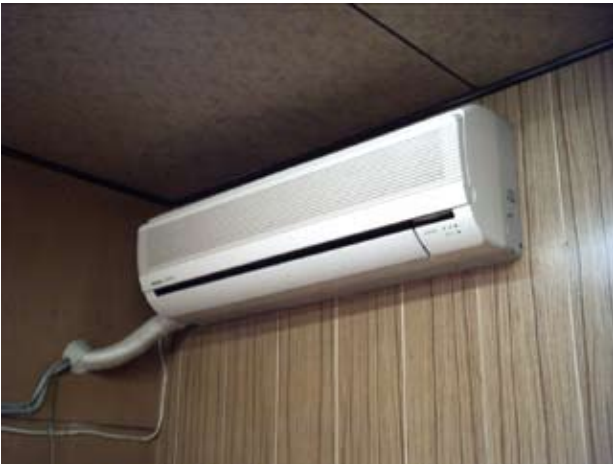
写真19 会議室エアコン