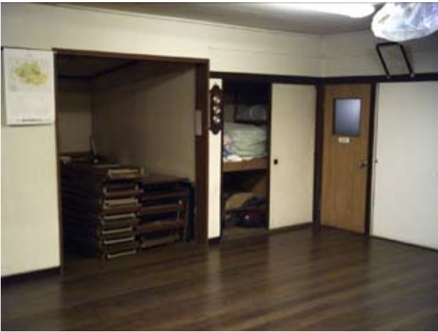
写真5 集会室北東面