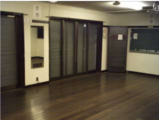
写真3 集会室南西面