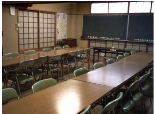
写真13 和室2・3東南面