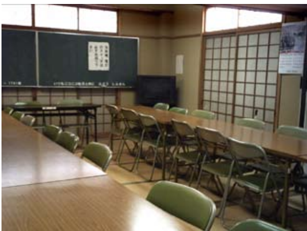
写真14 和室2・3南西面