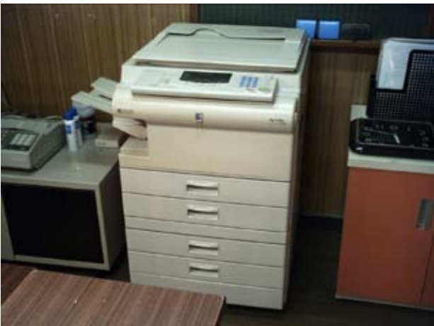
写真21 会議室コピー