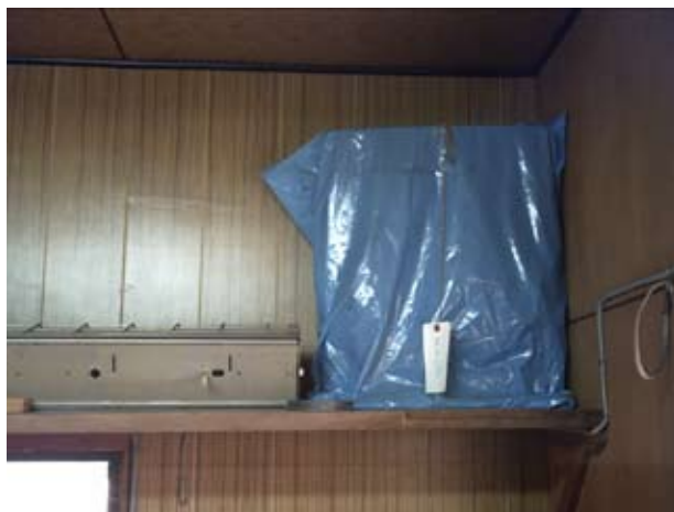
写真27 会議室上部棚