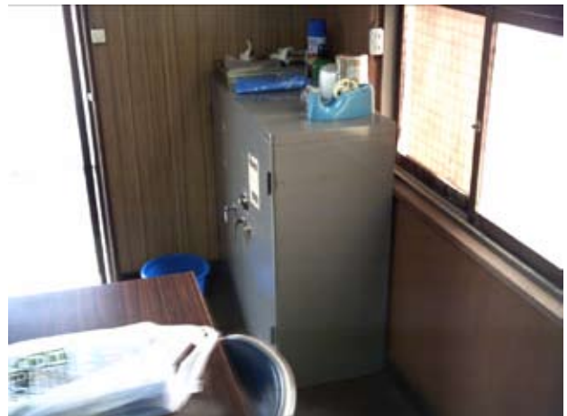
写真22 会議室ロッカー(1)