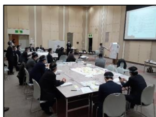
総会・意見交換会

これまで、会員での意見交換により、ロードマップや北部エリアの土地活用の方向性などの公表をはじめ、連携の強化や土地活用の機運醸成に繋がる様々な取組を実施しています。