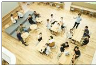
若者を対象とした起業家輩出プログラム

起業家、スタートアップ、社会課題解決に取り組む方、学生等やその支援者が集まり、交流・共創により、地域に新しい価値をもたらすイノベーション創出を目的として、さかい新事業創造センター（S-Cube）に交流拠点cha-shitsuを開設し、様々な交流を生む取組を実施しています。