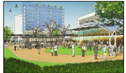
中百舌鳥イノベーション創出拠点イメージ（駅前）

中百舌鳥エリアで進めるイノベーション創出の取組と相乗効果を発揮した都市拠点にふさわしい駅前空間の創出に向けて、交通結節点機能や都市の拠点機能、玄関口としてのシンボル機能を強化するため、民間施設整備（令和6年度事業者公募予定）と併せた公民連携による駅前広場再編の検討を進めています。