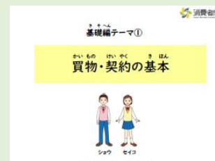
「特別支援学校向け消費者 教育用教材」(消費者庁)

専用サイトまたは学校の遠隔学習システムを使い、パソコン、タブレット、スマートフォンから受講します。一定期間、いつでも、どこでも受講可能です。