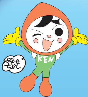
人権イメージキャラクター「人KENまもる君」