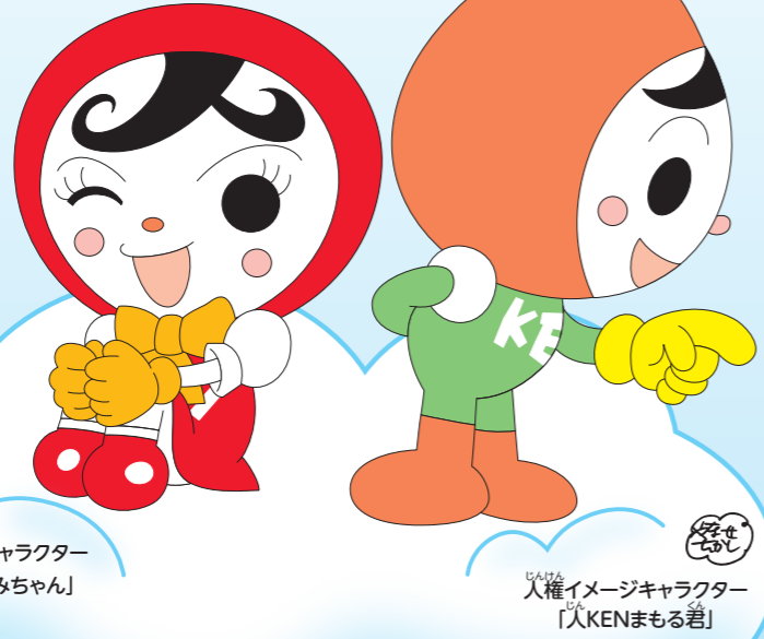
人権イメージキャラクター 「人KENあゆみちゃん」