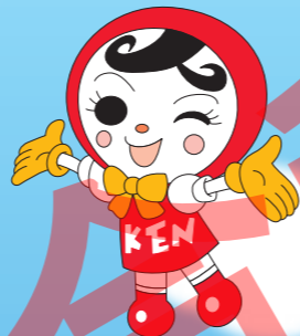
人権イメージキャラクター「人KENあゆみちゃん」