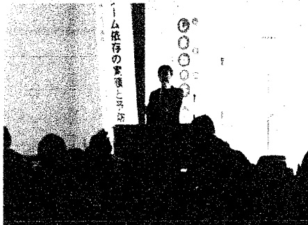
「ネットやゲーム依存の実態と予防」 専門家による講演