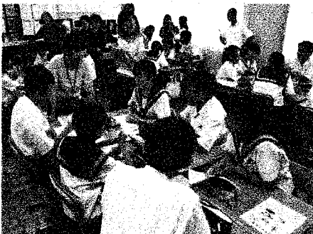
生活習慣づくり授業の様子