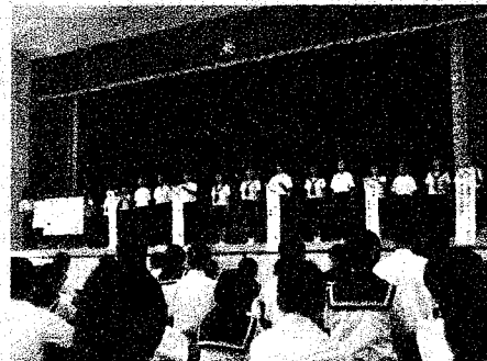
生徒による啓発活動の様子