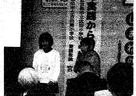
小学生による発表の様子