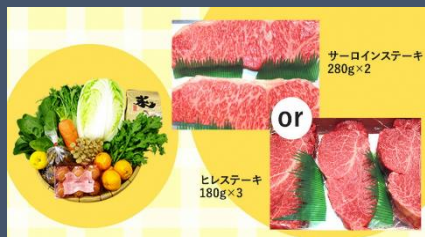
特選野菜とステーキのセット