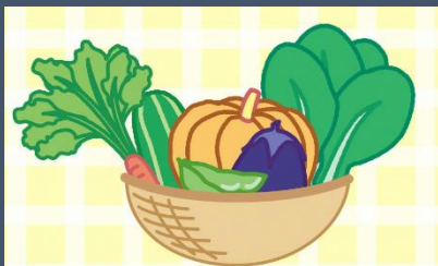
季節の野菜セット (ミニ)