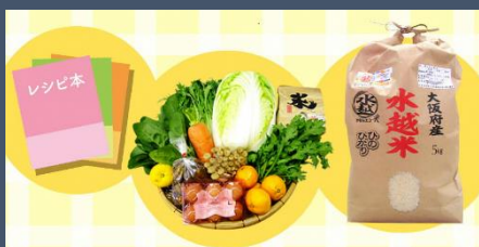
レシピ本と特選野菜と水越米のセット