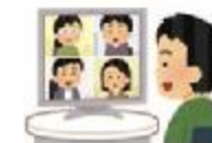
オンライン会議の実施