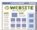
オンラインの活用